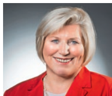
Cornelia Rundt Niedersächsische Ministerin für Soziales, Gesundheit und Gleichstellung